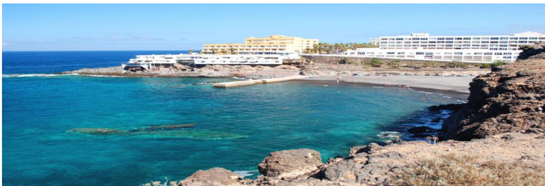
Salida Playa Ajabo de Callao Salvaje, Termino Municipal de la Villa Histórica de Adeje.

El recorrido será lineal y habrá tres puntos de control: el primero de ellos en la Salida. El segundo a los 3 kilómetros en el Balito – Marazul. El tercero a los 7 kilómetros, en Playa de San Juan en el Municipio de Guía de Isora y por último en la llegada de la Playa de Puerto de Santiago en el municipio de Santiago del Teide donde finalizará dicha prueba con aproximadamente unos 15 kilómetros.