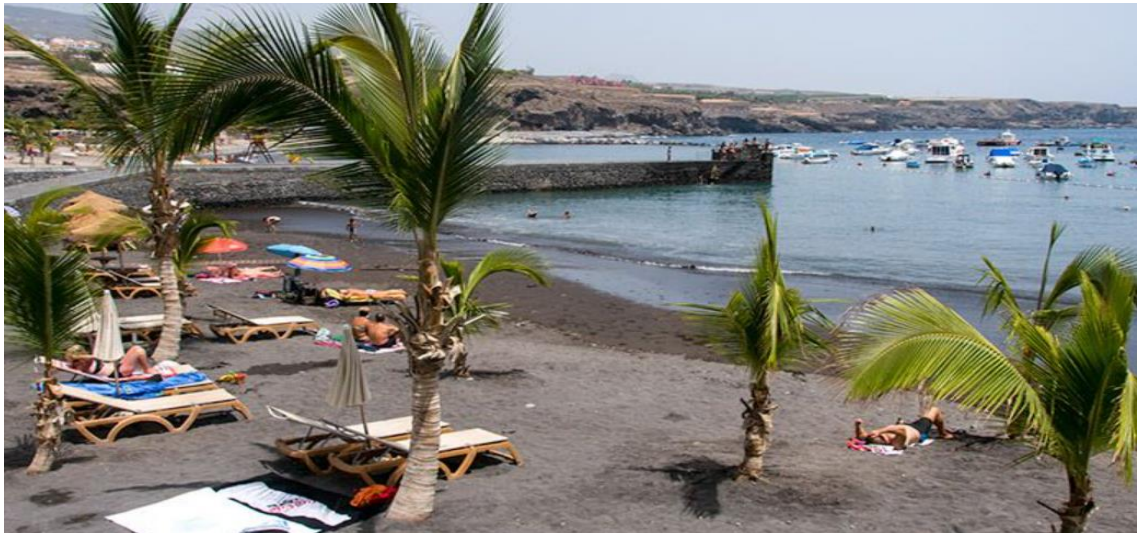
Playa de San Juan 2º Punto de Control 8 km aproximadamente de la Salida