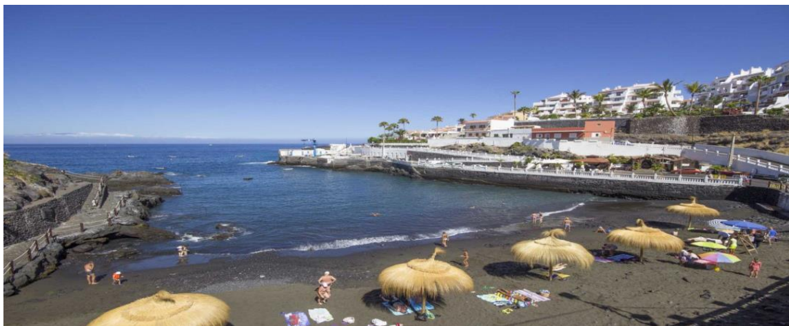
Playa de Puerto de Santiago, Termino Municipal de Santiago del Teide, llegada de la IV Travesía a Nado SOUTH WEST TENERIFE